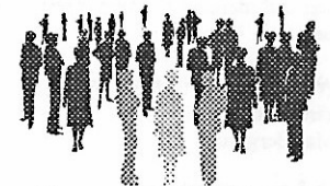
Gunnarskogsbor i farten