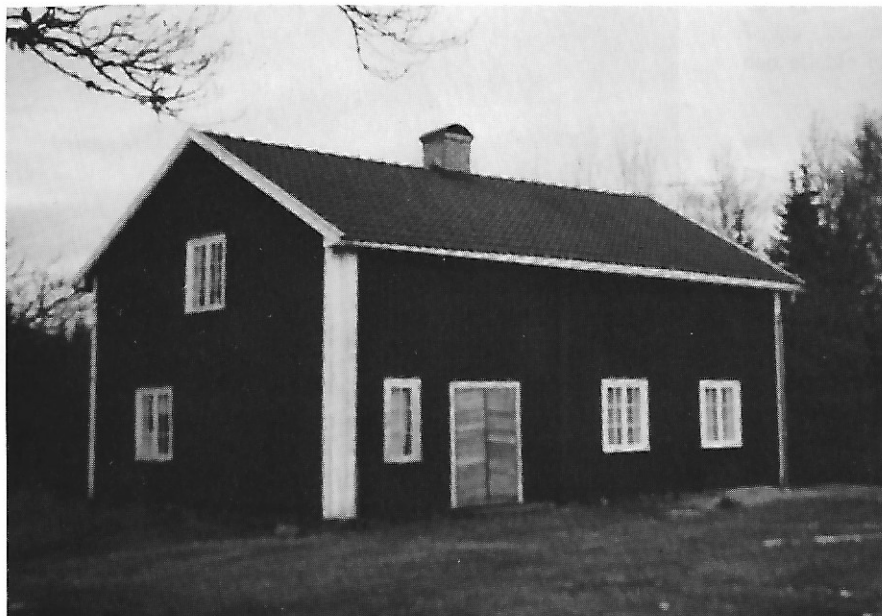
Där Nere i Abborrsjön